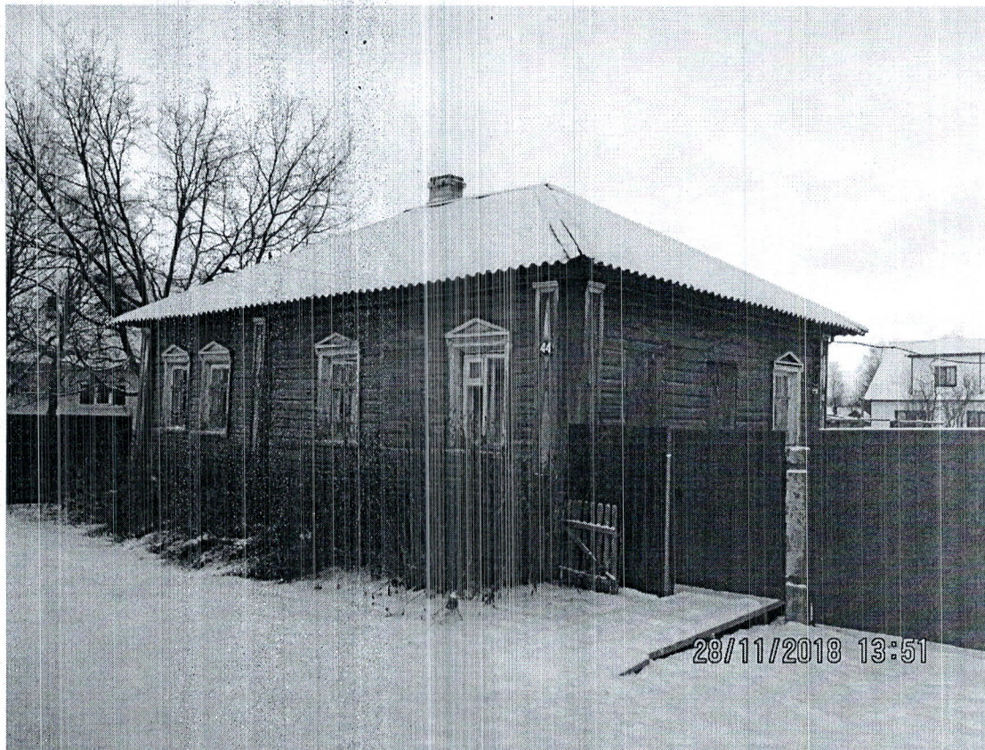
Фото здания, расположенного по адресу: ул. Архангельская, д.44 в г. Каргополе