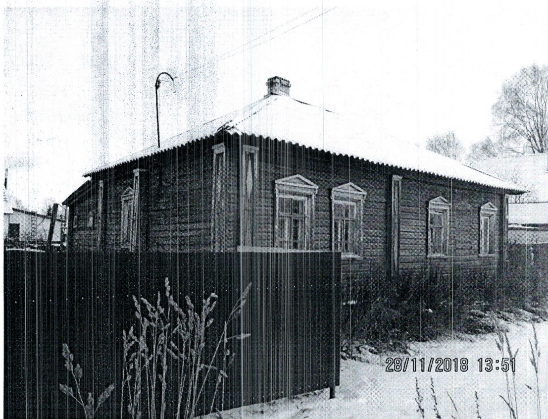
Фотоотчет, проверки 28.11.2018 по избавлению от «визуального мусора» и созданию привлекательного облика муниципального образования «Каргопольское».