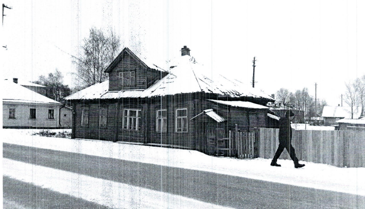
Фотоотчет, проверки 27.11.2018 по избавлению от «визуального мусора» и созданию привлекательного облика муниципального образования «Каргопольское».