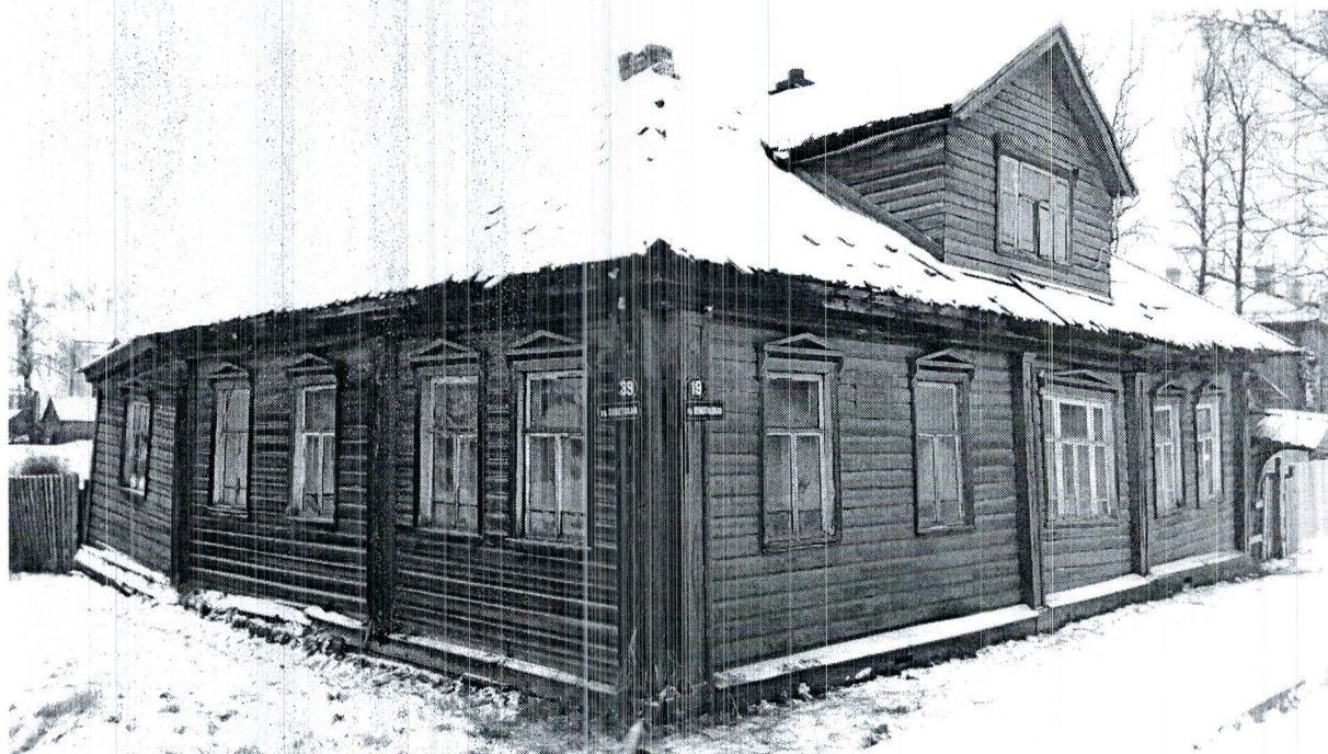
Фото здания, расположенного по адресу: ул. Ленинградская, д.19 в г. Каргополе