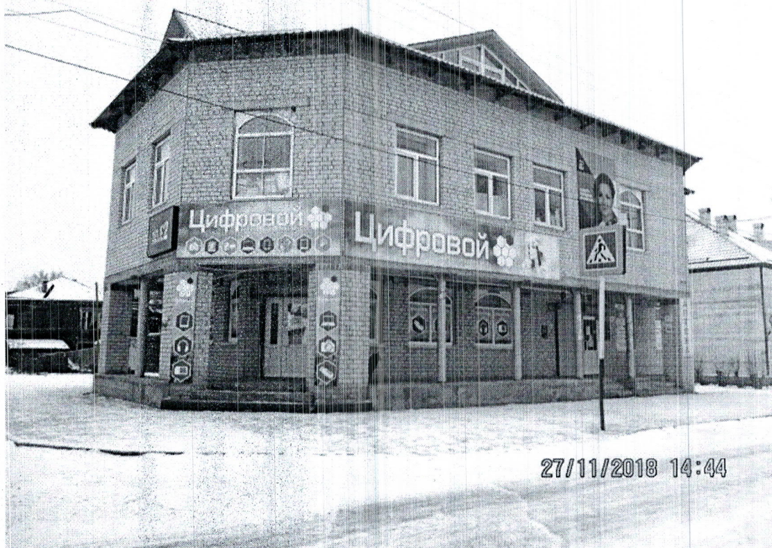
Фото здания, расположенного по адресу: ул. Ленина, д.67 в г. Каргополе