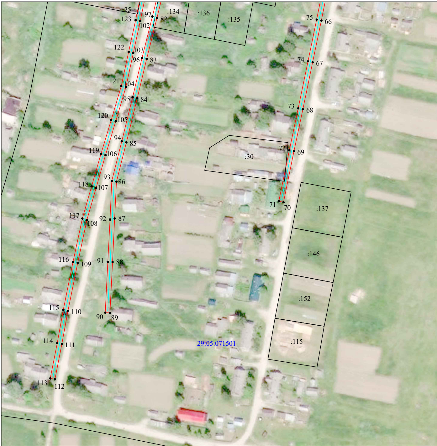
Масштаб 1:2 000