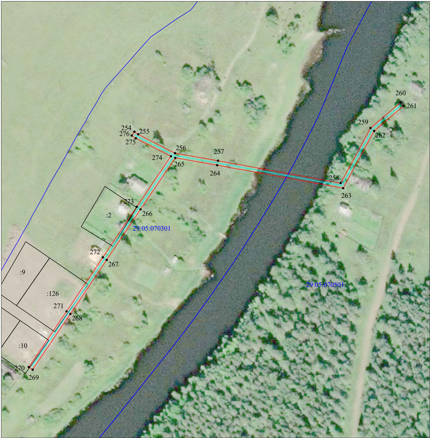
Масштаб 1:2 000

Схема расположения границ публичного сервитута объекта электросетевого хозяйства "ВЛ-0,4 кВ от КТП "Поселок СХТ" ВЛ-10 кВ "№ 2" ПС "Каргополь", ВЛ-0,4 кВ от КТП-160 кВА "Пилорама" ВЛ-10 кВ "№ 2" ПС "Каргополь", ВЛ-0,4 кВ от КТП-63 кВА "Чертовицы отгонное пастбище" ВЛ-10 кВ "Центральная Усадьба" ПС "Каргополь", ВЛ-0,4 кВ от КТП "Лукино КЗС" ВЛ-10 кВ "Саунино" ПС "Каргополь", ВЛ-0,4 кВ от КТП "Лукино ферма" ВЛ-10 кВ "Саунино" ПС "Каргополь"